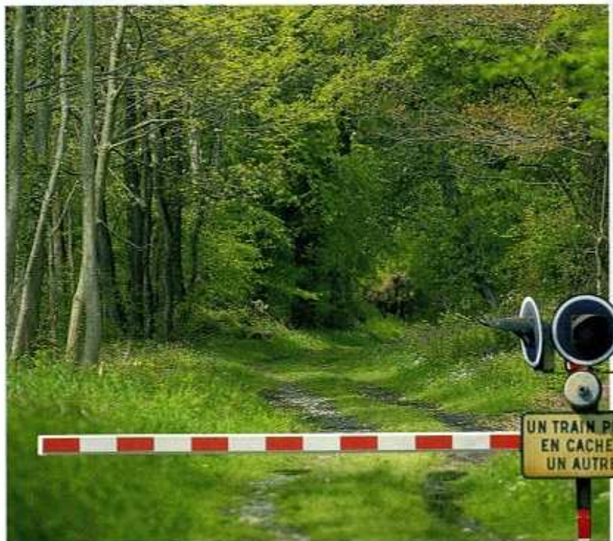
Le chemin de la ligne vieille emprunte le premier tracé de la voie ferrée entre Tarbes et Bayonne.

Départ : commune de Aussevielle. Parking de la mairie.