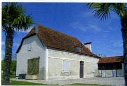
Béarnaise typique devenue "centre d'activités associatives"

Au contact de la route, descendre et traverser la voie ferrée. Continuer sur la route principale. Prendre à droite vers la mairie